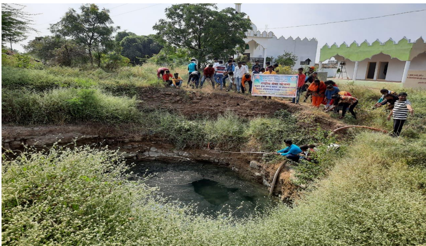
Cleaning the well

Signature IC Principal Shri Chhatrapati Shikshan and Arogya Prasarak Mandal's Shri Sant Gajanan Mahavidyalaya, Kharda Tal. Jamkhed, Dist. Ahmednagar