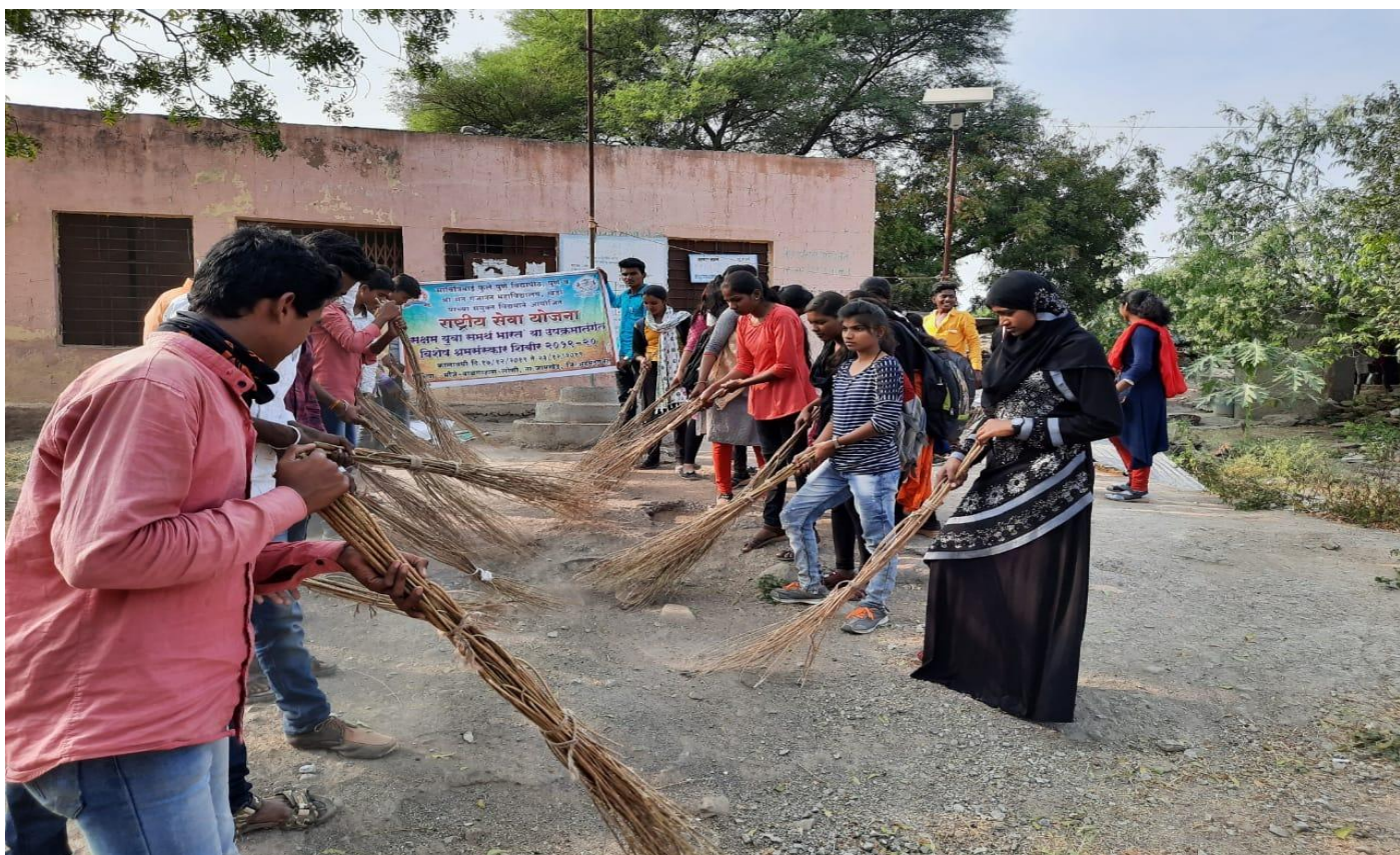
Students are Village cleaning