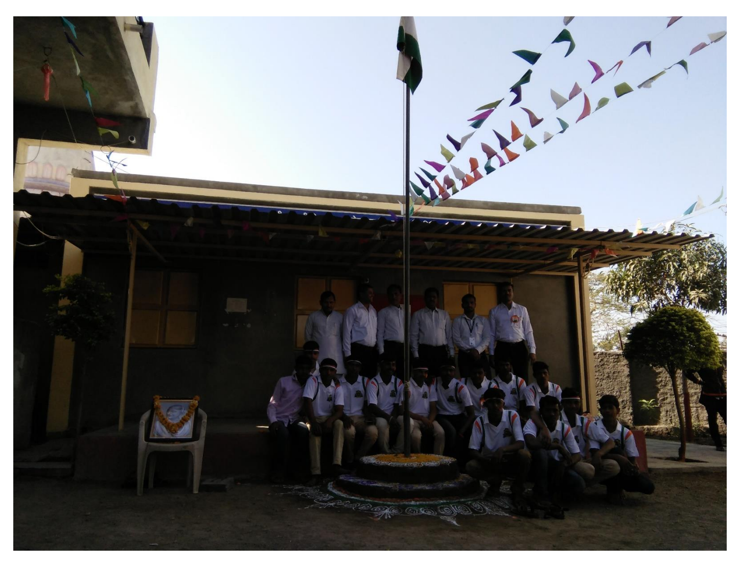
Celebrating Independence Day