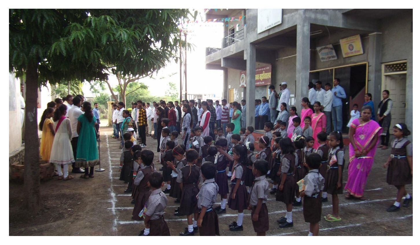
Celebrating Independence Day