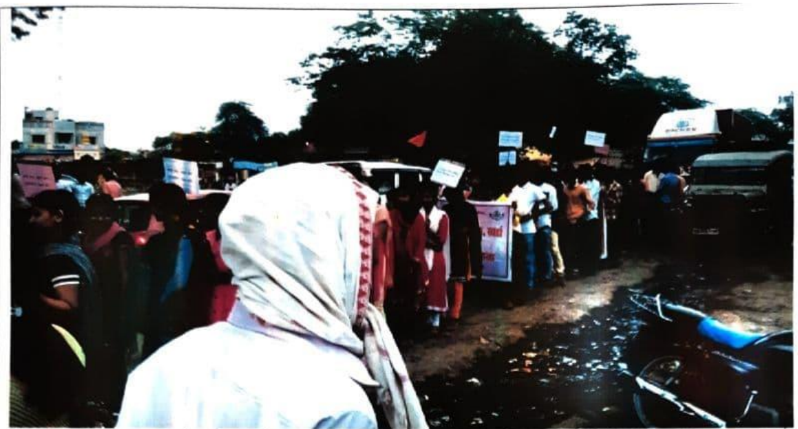
Rally organized on the occasion of fortnight of goodwill, At. kharda. 27/08/2018