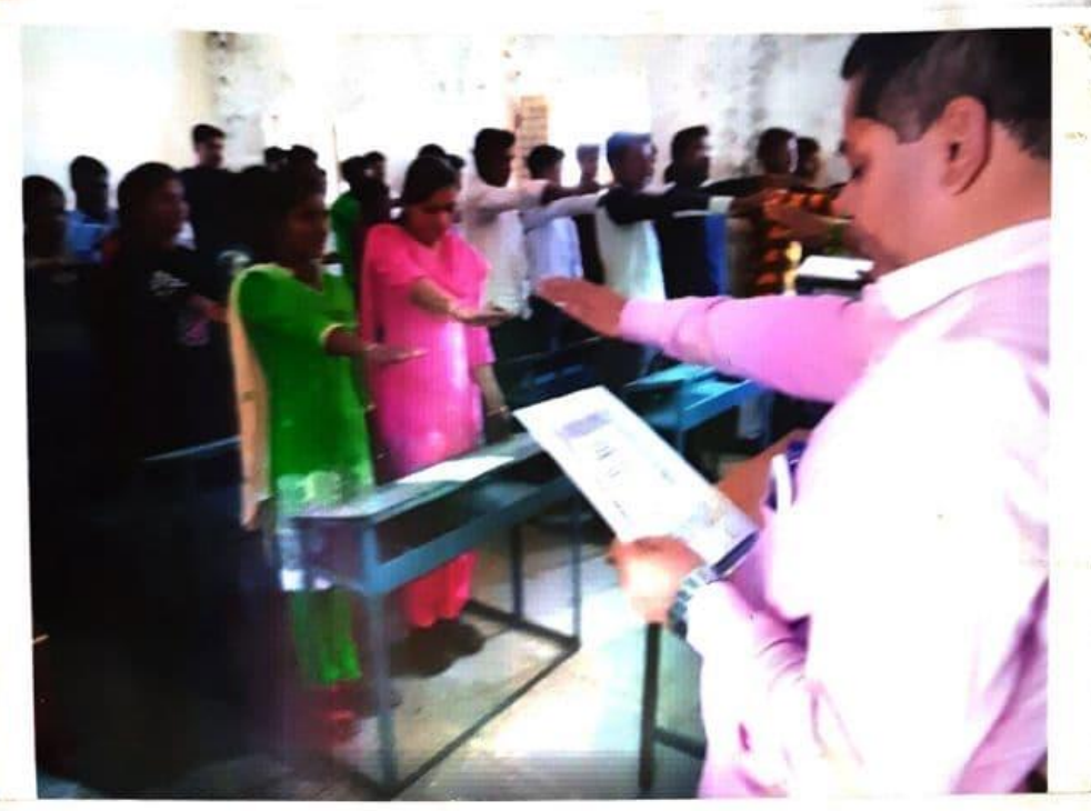
'न्देविधान दिन 'पृत्तंत्रि संविधान सरनाम्याचे वाचन करनाना रासेथी स्वांसीवक