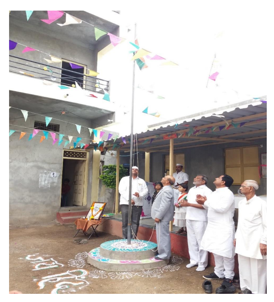
Celebration of Republic Day