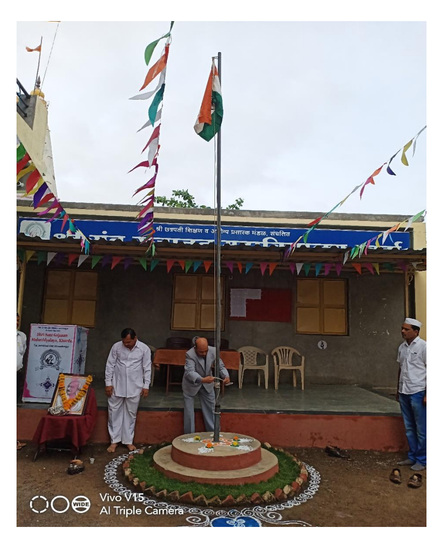
Celebrating republic day