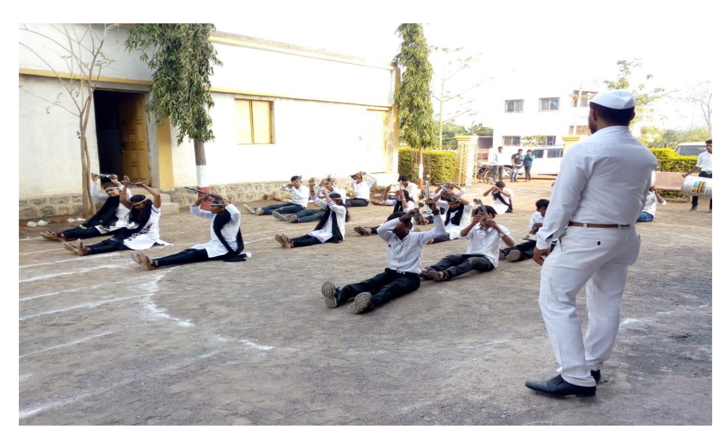
Laizim demonstration on the occasion on Republic day