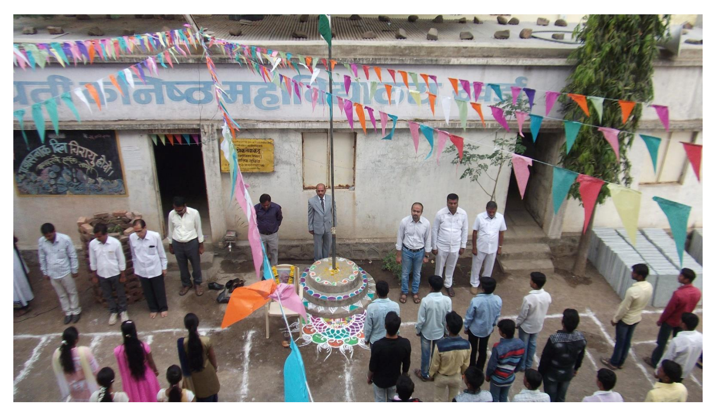
Celebrating Republic day