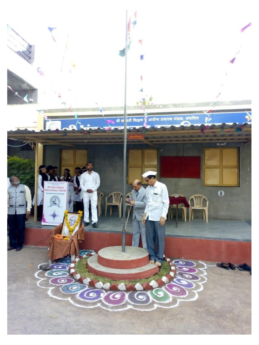
Celebrating republic day