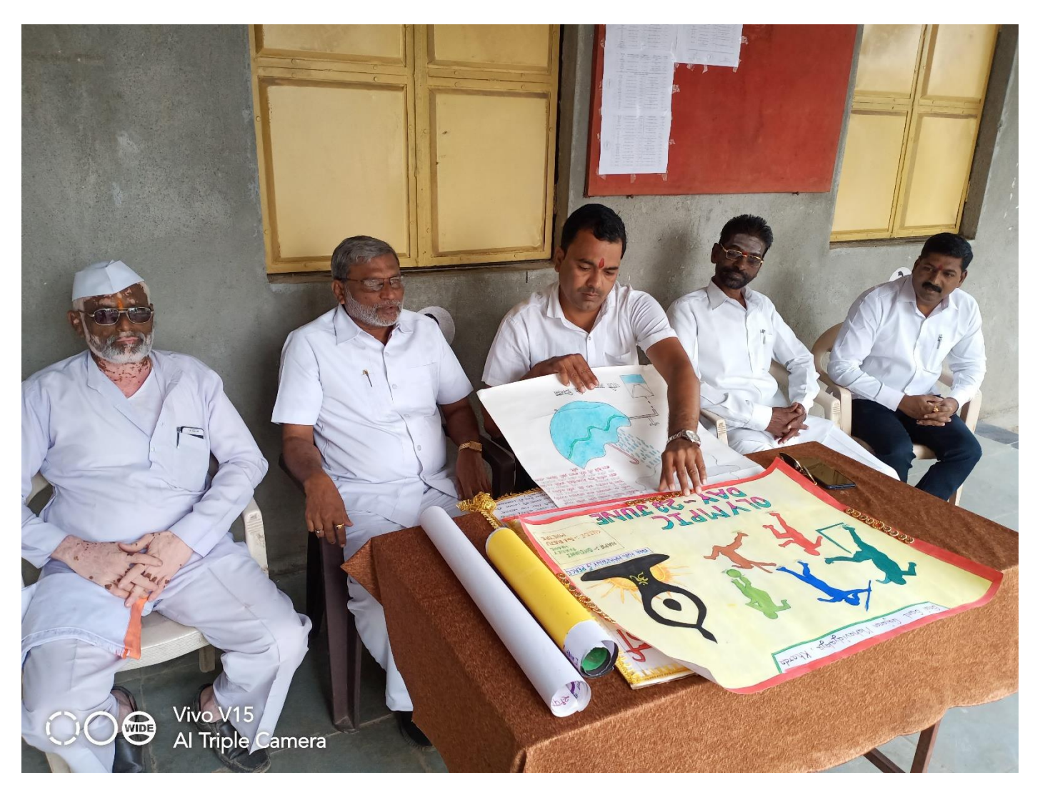
Wallpaper published by students

Shri Chhatrapati Shikshan and Arogya Prasarak Mandal's Shri Sant Gajanan Mahavidyalaya,Kharda Tal.Jamkhed, Dist. Ahemednagar