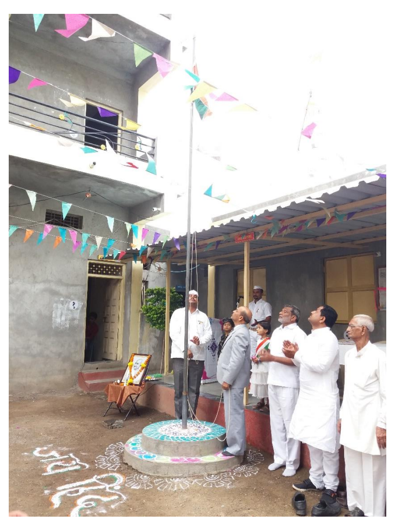
Celebrating republic day