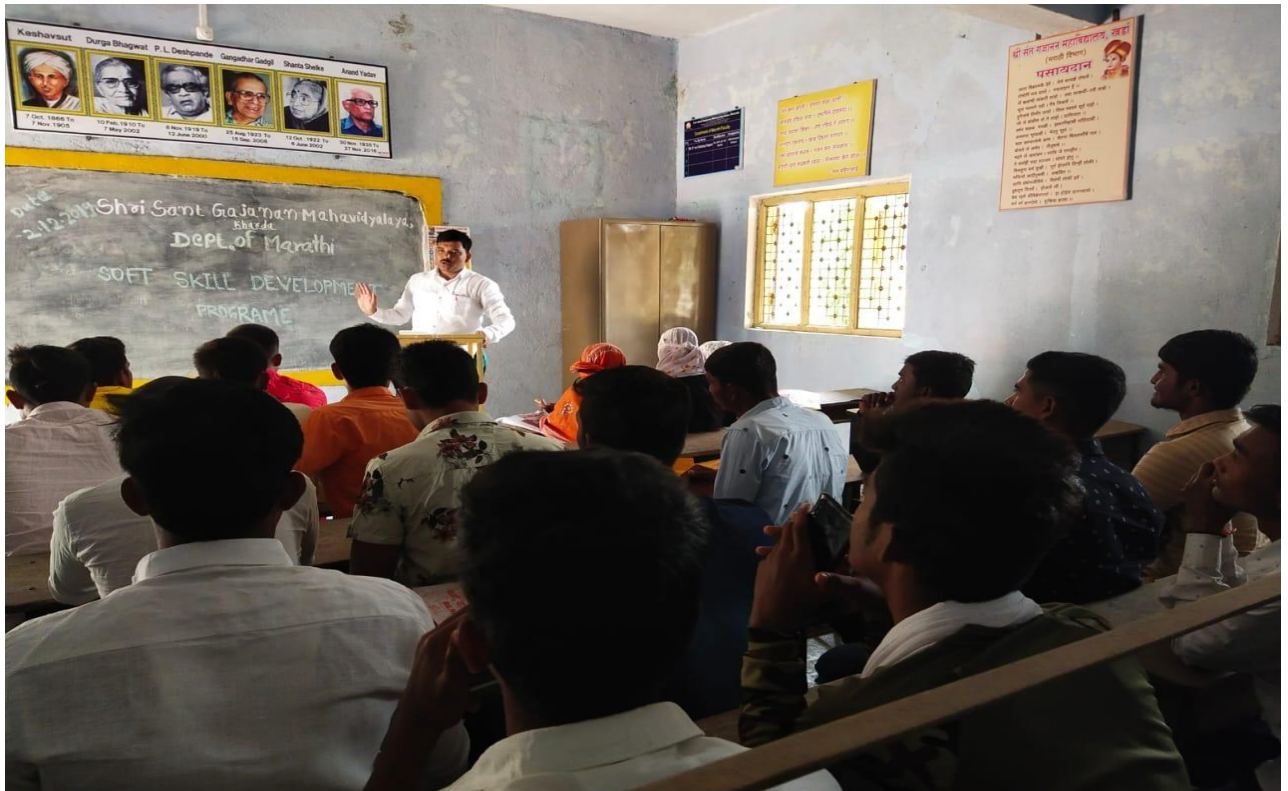
Soft skill development programme organized by Dept. of Marathi on "Vrutta Lekhan"