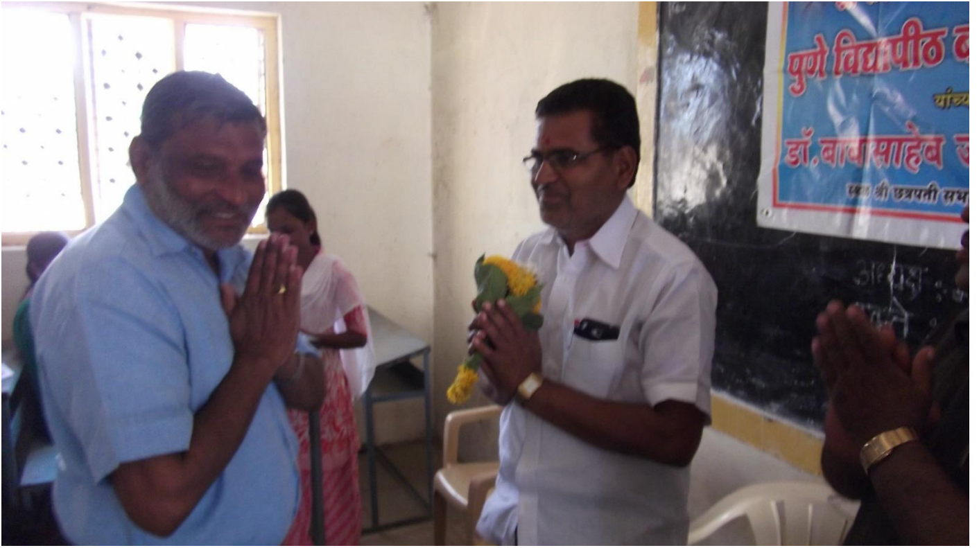
Lecture under Dr. Babasaheb Jayakar Vyakhyanmala