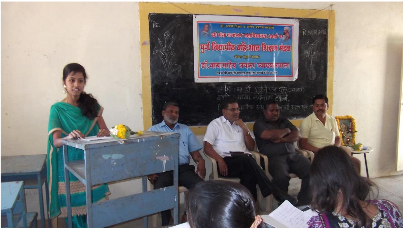
Vote of thanks delivered by Student